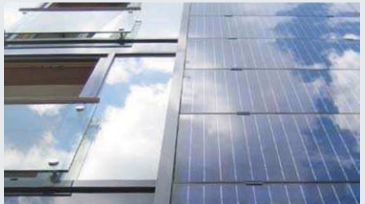
Auf Maß gefertigte DUETT-MegaSlate® Solarlamine zur vollständigen Fassadenintegration in Landsberg (D).