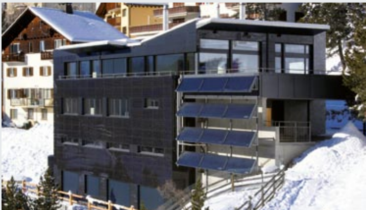
Vorgehängte hinterlüftete Glasfassade mit rahmenlosen DUETT-MegaSlate® Solarlaminen in St. Moritz (CH).

Für unsere standardisierten Lösungen setzen wir geregelte Baustoffe ein. Bei individuellen Fassadenplanungen ist eine allgemeine bauaufsichtliche Zulassung oder eine Zustimmung im Einzelfall (ZiE) einzuholen.